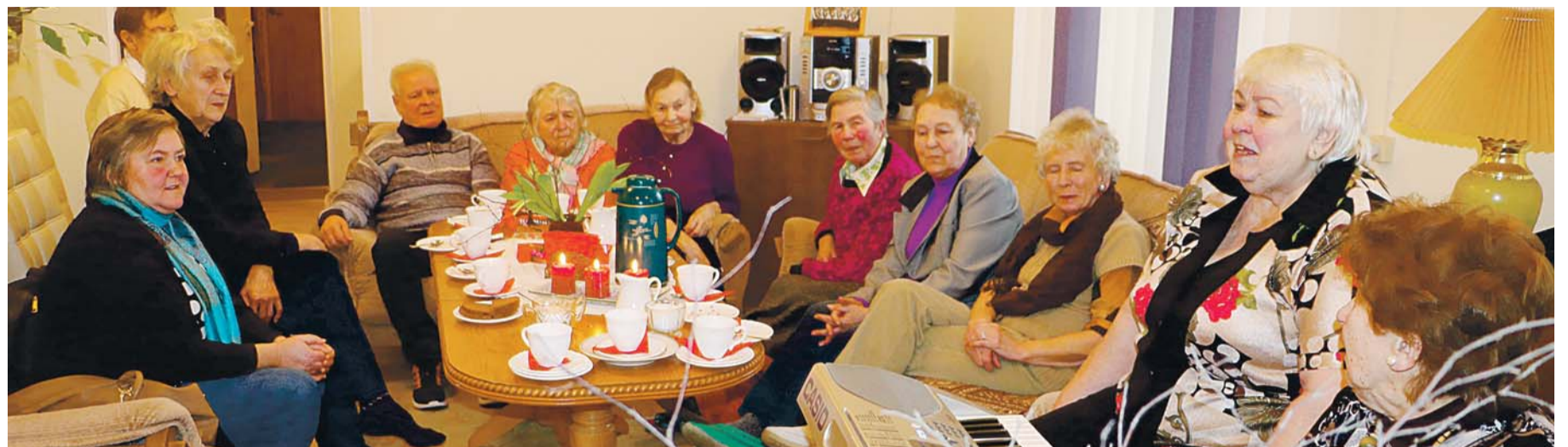
Kostivere päevakeskuse inimesed küünlapäeva tähistamas.