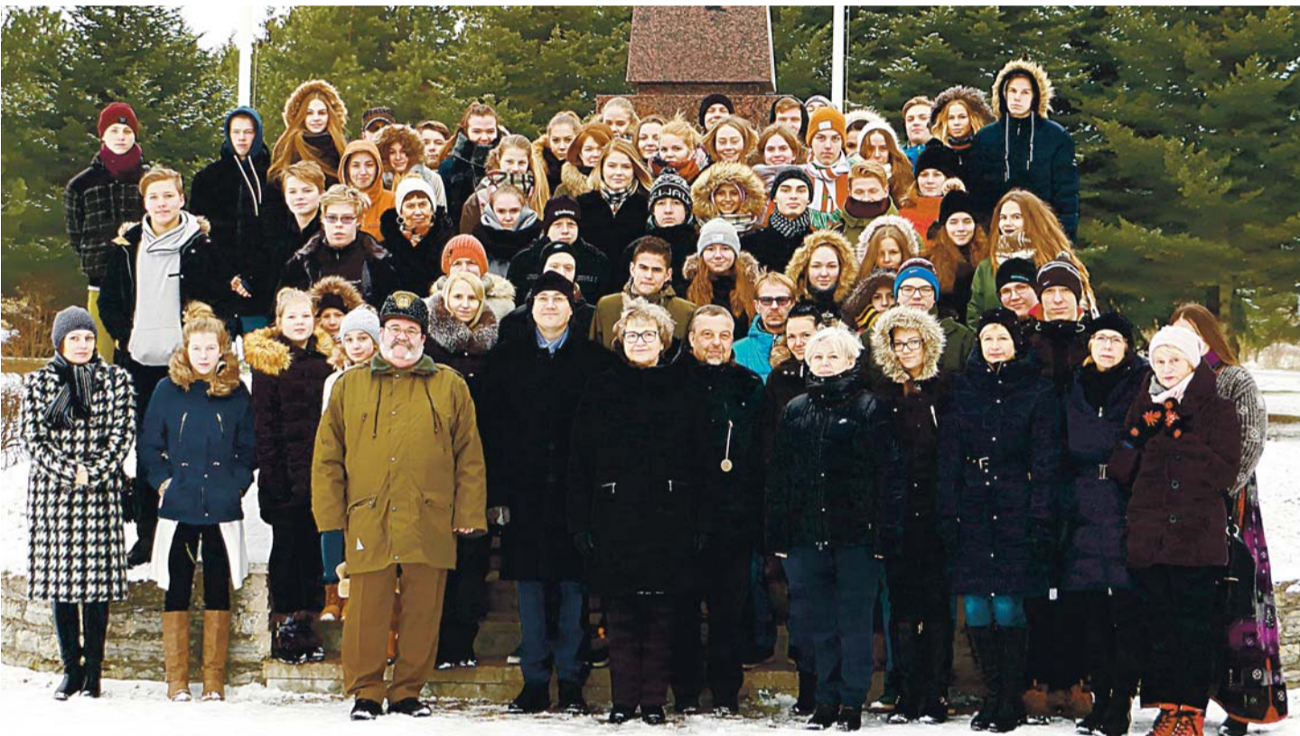
Mälestushetkele Vabadussamba juurde kogunesid valla noored.